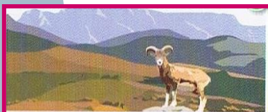
Parc naturel régional du Haut-Languedoc

Nota: Les nuitées en camping, les visites payantes effectivement réalisées seront à régler sur place.